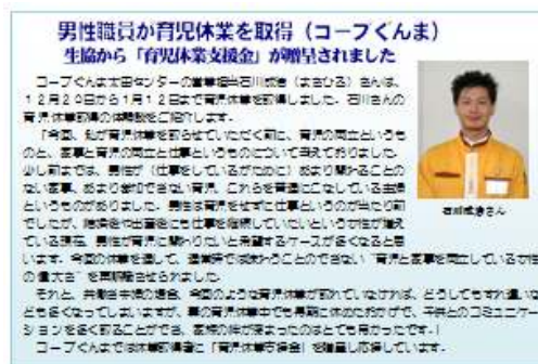
男性職員の育児休業取得を「風」で紹介 (コープぐんま)